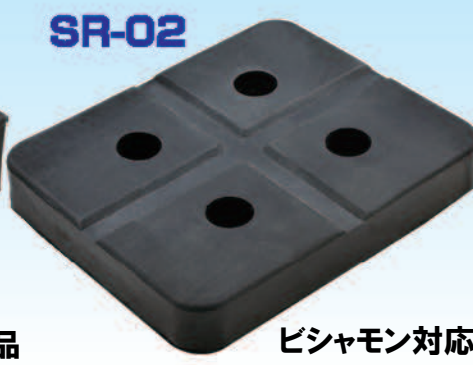
ビシャモン対応品

幅:112 奥行:92 高さ:18 A:40 B:45mm 適応機種: SP2500(後期型)